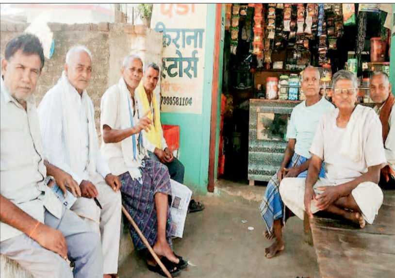
महिला व बुजुर्गों की बड़ी परेशानी